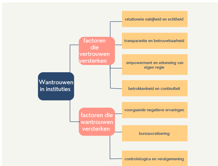
Figuur 2: factoren vertrouwen en wantrouwen (Debonnet, factoren vertrouwen en wantrouwen )

Daarnaast speelt de onderliggende controlelogica een cruciale rol. Hoewel intakeprocedures vaak worden ontworpen met het doel om zorgvuldigheid en veiligheid te waarborgen, worden zij in de praktijk veelal ervaren als controlemechanismen die vertrekken vanuit wantrouwen. Zoals ook uit de interviews naar voren kwam, worden alle cliënten onderworpen aan uitgebreide en gestandaardiseerde vragenlijsten, voornamelijk om mogelijk misbruik door een kleine minderheid te voorkomen. Deze overregulering kan bij cliënten het gevoel oproepen dat zij zich moeten verantwoorden of bewijzen, wat bijdraagt aan een versterking van het wantrouwen ten aanzien van de hulpverlening (Arts, 2024) (1 B. , 2025) (2, 2025) (3, 2025).