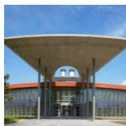
OPZ DAELWEZETH REKEM