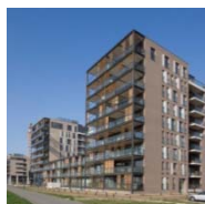
DE ZAAAT TEMSE