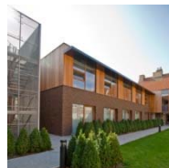
WZC O.L.V. VAN TROOST WESTKAPELLE