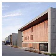
HOWEST - PIH KORTRIJK