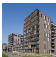
DE ZAAIT TEMSE