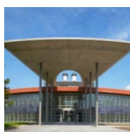
OPZ DAELWEZETH REKEM