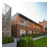
WZC O.L.V. VAN TROOST WESTKAPELLE