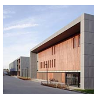
HOWEST - PIH KORTRIJK