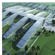
NAVO HQ EVERE