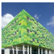
INFRA-X WEST TORHOUT