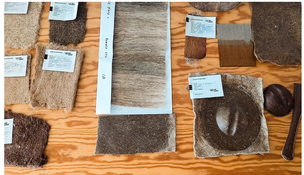
Samples vanuit het onderzoeksproject Rewilding Materials

Meest kansrijke gewassen zijn volgens Johan paulownia (niet-invasieve rassen) en mammoetgras (beter dan olifantsgras). Deze meerjarige gewassen hebben een zeer hoge productiviteit en stellen weinig eisen aan de bodem. In Budel en Emmen zijn al verwerkingsfabrieken in ontwikkeling. De gewassen daarvoor zouden binnen een straal van 50 tot 100 km verbouwd moeten worden. Ook sorghum biedt veel mogelijkheden, niet alleen voor bouwmaterialen, maar ook voor voeding, voer en bioraffinage. In de regio Tilburg wordt al gestart met 200 ha teelt. Dit kan ook een interessant gewas zijn voor Landschapspark de Merode. De eisen t.a.v. certificering van bouwmaterialen zijn in Vlaanderen wel strenger dan in Nederland, wat het moeilijker maakt om nieuwe producten op de markt te brengen. Voor vezelcomposieten geldt dat minder.