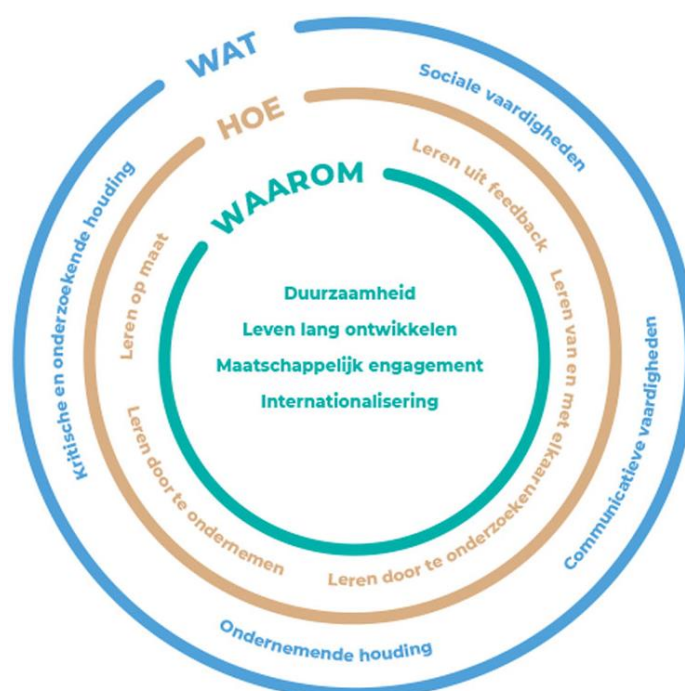
Figuur 1: De HOGENT-visie op onderwijs